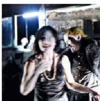
Lulu. Eine Mörderballade

ESTRÉE OF T. WESSELDAMN, VG BILD KUNST, BONN