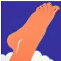
American Pop Art

ESTRÉE OF T. WESSELDAMN, VG BILD KUNST, BONN