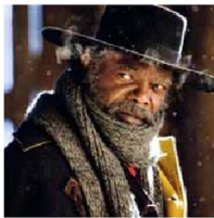
The Hateful 8